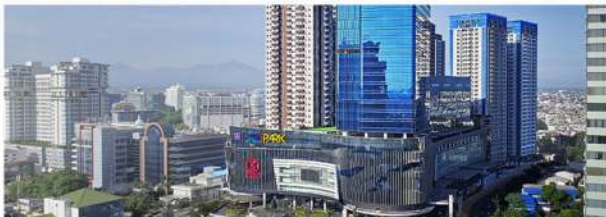
25 MENIT PUSAT INTI KOTA MEDAN