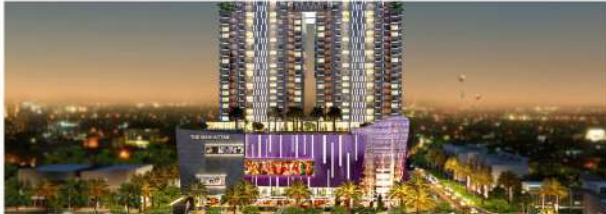
15 MENIT MANHATTAN TIMES SQUARE