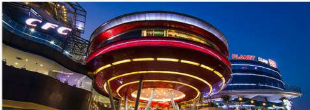
10 MENIT RINGROAD CITYWALKS