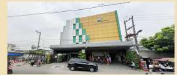
➤ 5 Menit ke RS Mitra Medika