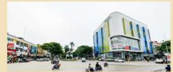
➤ 10 Menit ke Cemara Asri