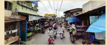
➤ 2 Menit ke Pasar Pagi Brayan Bengkel