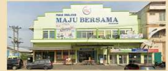
➤ 5 Menit ke Swalayan Maju Bersama