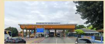
➤ 5 Menit ke Pintu Tol Tanjung Mulia